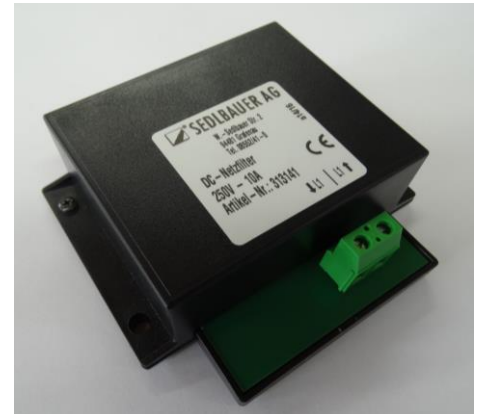
Bild: DC-Netzfilter 313141